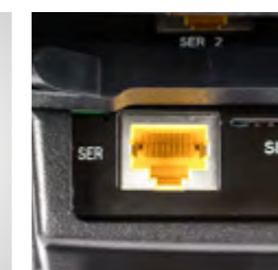
Connexion directe à la nouvelle antenne Orderman OMB4 sans alimentation électrique additionnelle (PoE) (option)