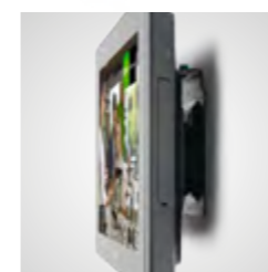
Pour montage au comptoir ou mural (VESA)

Demandez des informations à votre partenaire Orderman ou en envoyant un message à sales@orderman.com .