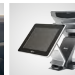
Écrans clients dans plusieurs modèles (option)